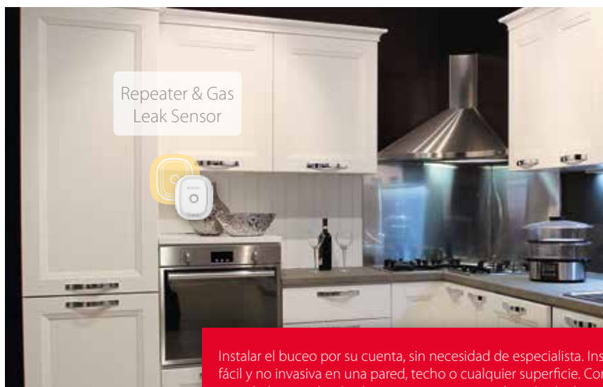
Repeater & Gas Leak Sensor

Instalar el buceo por su cuenta, sin necesidad de especialista. Instalación fácil y no invasiva en una pared, techo o cualquier superficie. Con las gradas articuladas, instalación de equipos es muy simple y rápida de realizar.