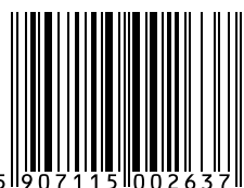
Water Leak Sensor

Instalar el buceo por su cuenta, sin necesidad de especialista. Instalación fácil y no invasiva en una pared, techo o cualquier superficie. Con las gradas articuladas, instalación de equipos es muy simple y rápida de realizar.